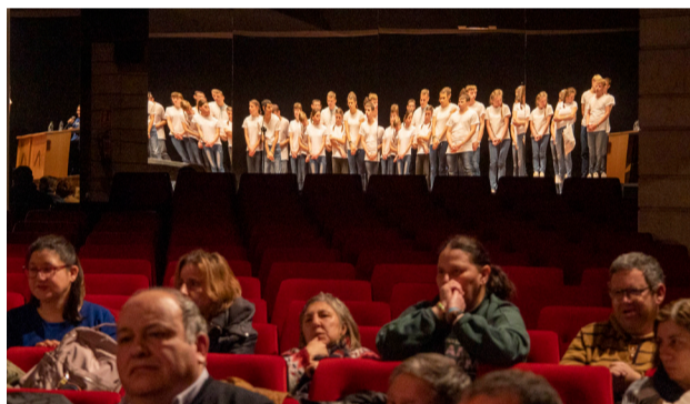
La actuación del coro de Ucrania reflejada tras el público.